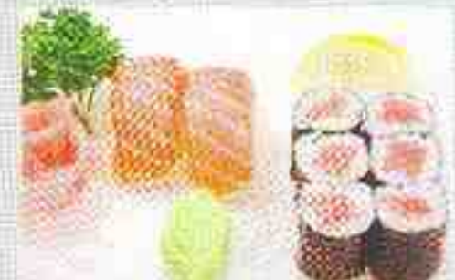
F: 2 sushi saumon, 6 maki thon 15€00