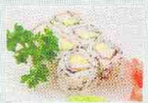
C: 6 california 12€90