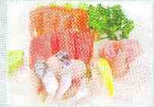
B: 10 sashimi 15€50