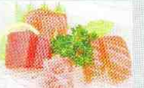
D: 2 sushi saumon, 4 sashimi 15€00