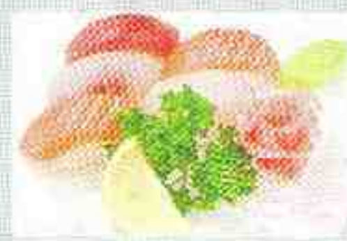
A: 5 sushi 14€50