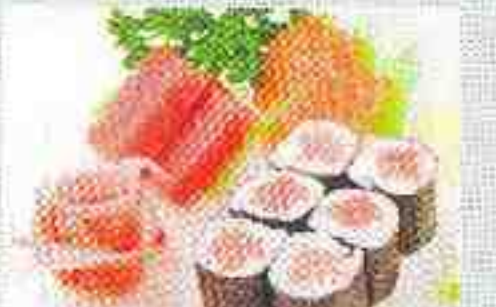
E: 4 sashimi, 6 maki thon 15€00