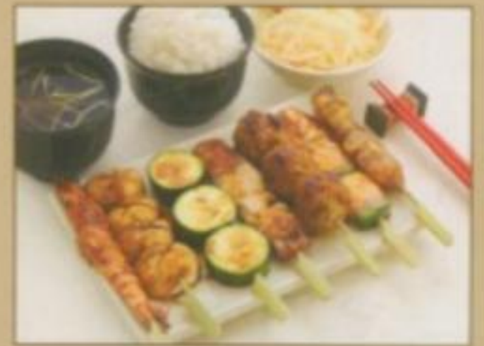
[MENU 10] 14.50 € Soupe, salade, riz nature, 7 brochettes. (1 gambas, 1 saumon, 1 champignon, 1 courgette, 1 boulette de poulet, 1 aile de poulet, 1 bœuf au fromage)