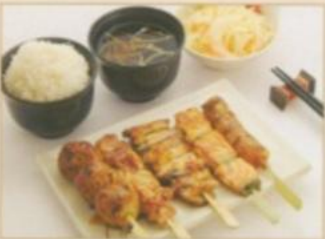
[MENU 06] 8.90 € Soupe, salade, riz nature, 5 brochettes. (1 boulette de poulet, 1 cuisse de poulet, 1 aile de poulet, 1 saumon, 1 bœuf au fromage)