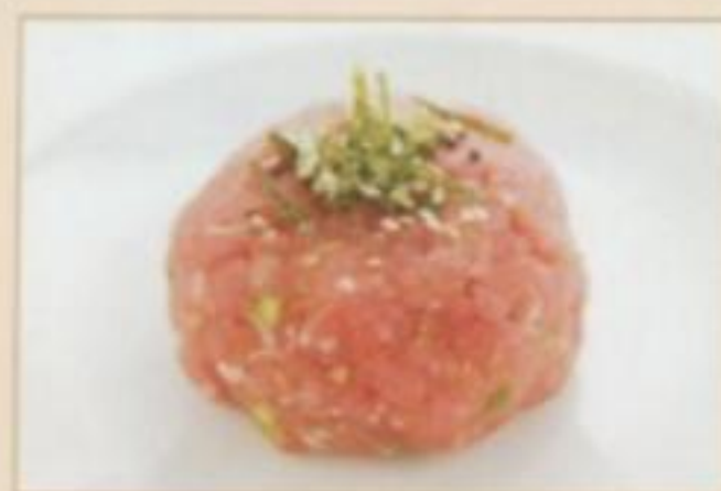
E10 MAGURO NO TATAKI 7.50 € Thon haché à la ciboulette