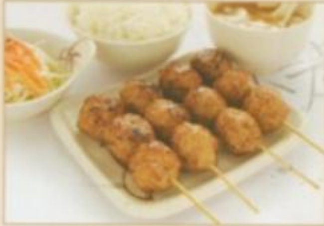
[MENU 02] 7.90 € Soupe, salade, riz nature, 4 brochettes boulette de poulet.