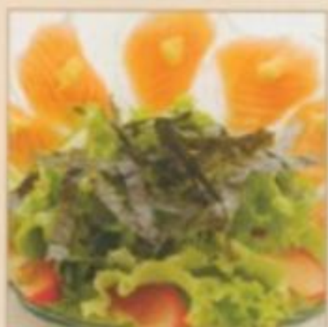
E11 SHAKE SALADE 9.00 € salade de Saumon