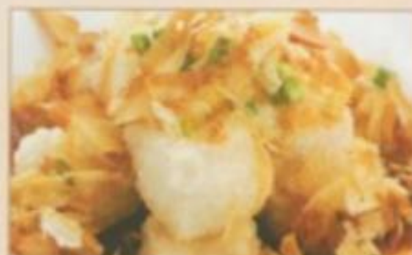
E06 AGEDASHI TOFU 7.50 € Tofu grillé