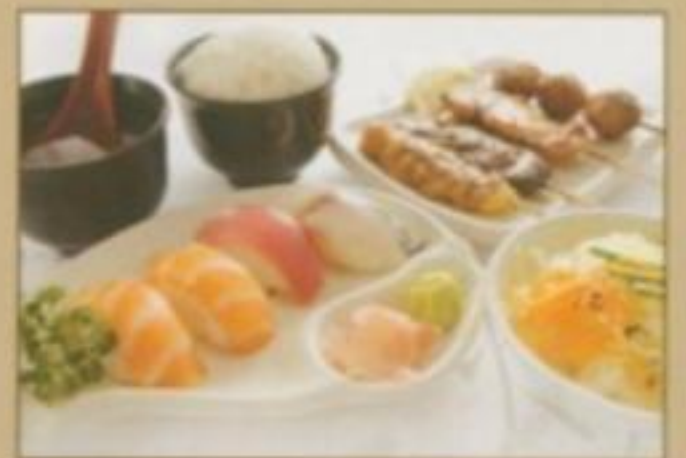
[MENU 12] 14.00 € Soupe, salade, riz, assortiment de sushi variées (4 pièces) 4 brochettes (1 poulet, 1 boeuf, 1 boulette de poulet, 1 boeuf au fromage)