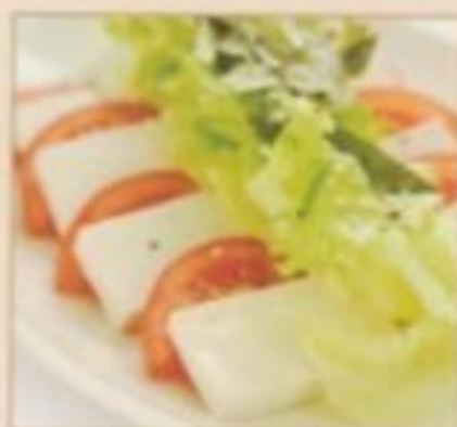
E05 SALADE DU TOFU 6.50 € Végétarienne