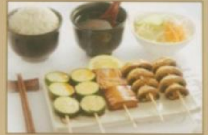
[MENU 08] (Végétarien) 8.50 € Soupe, salade, riz, 5 brochettes (2 champignons de paris, 2 courgettes, 1 pâte soja)