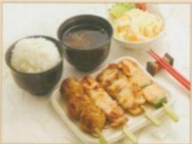
[MENU 03] 7.90 € Soupe, salade, riz nature, 4 brochettes. (1 boulette de poulet, 1 cuisse de poulet, 1 aile de poulet, 1 saumon)