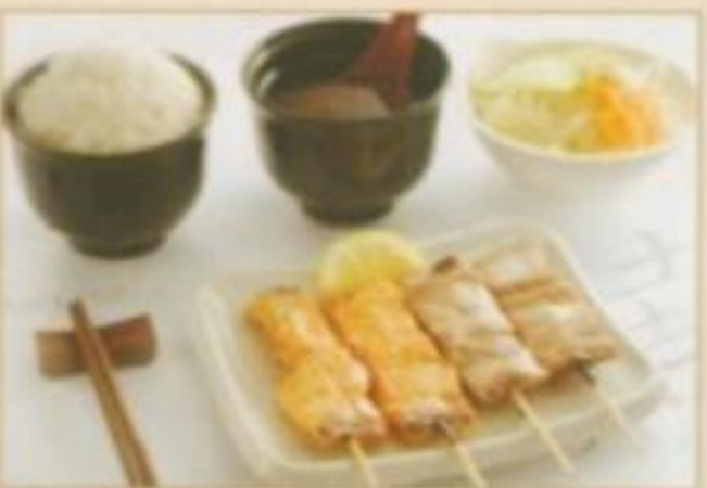
[MENU 05] 8.90 € Soupe, salade, riz nature, 4 brochettes de poisson variées