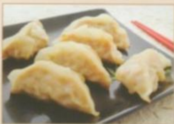
E12 GYOZA 6.00 € 6 Raviolis grillés