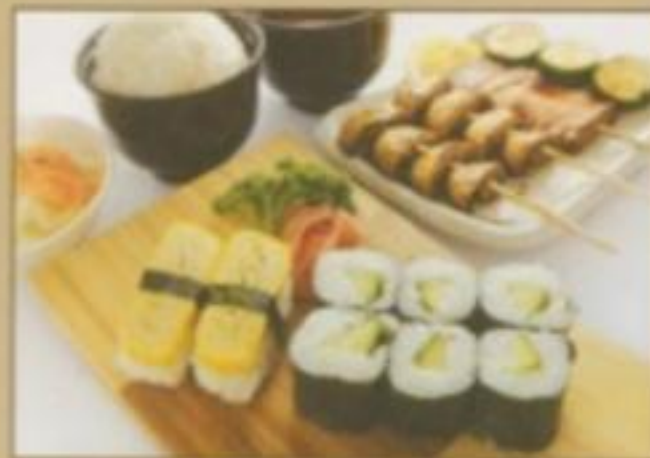
[MENU 11 DIETETIQUE] 13.00 € Soupe, salade, riz nature, 2 sushis omelette, 6 makis concombre, 4 brochettes (2 champignons de paris, 1 pâte soja, 1 courgette)