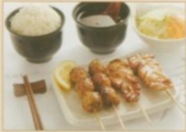
[MENU 01] 7.50 € Soupe, salade, riz nature, 4 brochettes (2 boulettes de poulet, 2 cuisse de poulet)