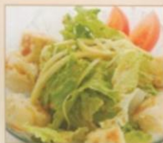
E04 SALADE AGEDASHI 9.00 € Tofu grillé salade