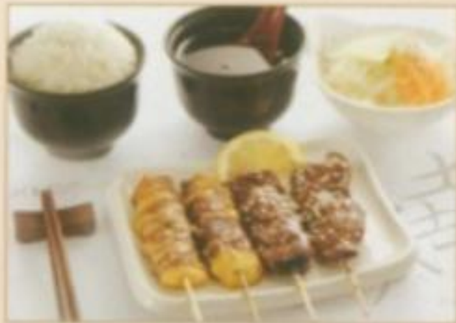
[MENU 04] 7.90 € Soupe, salade, riz nature, 4 brochettes (2 boeufs au fromage, 2 boeufs)