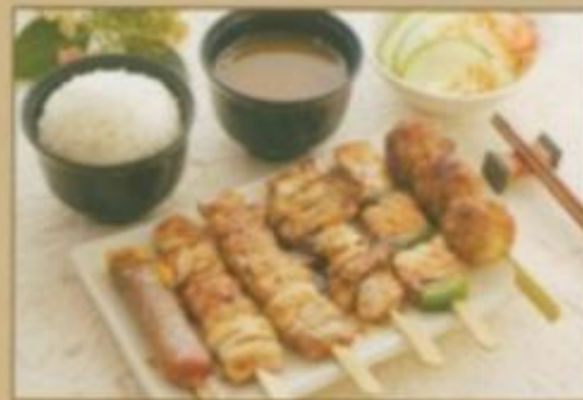
[MENU 09] 10.50 € Soupe, salade, riz nature, 6 brochettes. (1 boulette de poulet, 2 cuisse de poulet, 1 aile de poulet, 1 saumon, 1 bœuf au fromage)