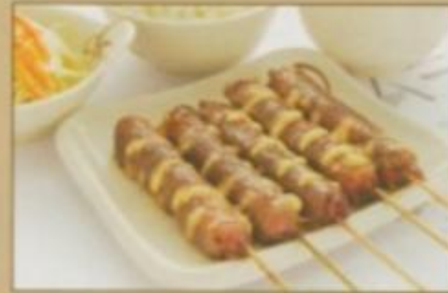
[MENU 07] 10.50 € Soupe, salade, riz nature, 5 brochettes (boeuf au fromage)