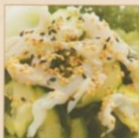
E08 TAKO SU 6.50 € Poulpe, algue et concombre à la vinaigrette