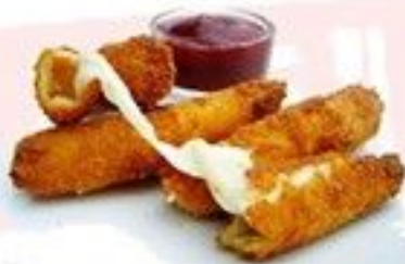
Mozza sticks 4.50 € les 9