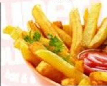
Frites 2.50 €