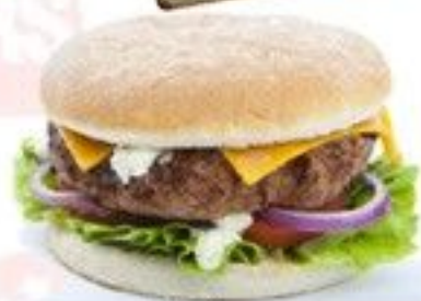
Le Bang 5 €