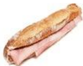
Le jambon beurre 3.50 €