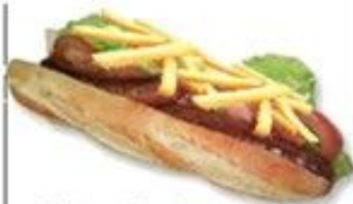
L'Americain merguez (double merguez frite) 5.50 €