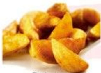
Potatoes 3 €