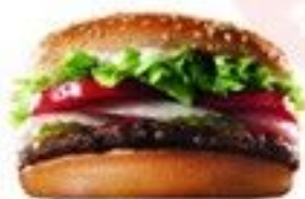
Le Double Cheese 3.50 €