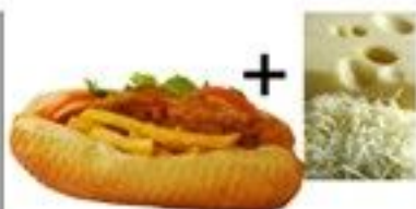
Le Californien (steack frite + fromage) 6 €