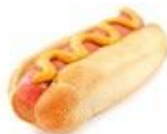
Le big hot-dog (double saucisses) 3.50 €