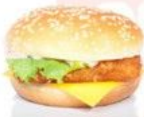
Le Chicken Burger 4 €