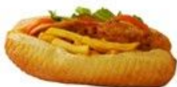
L'Americain (Steack frite) 5.50 €