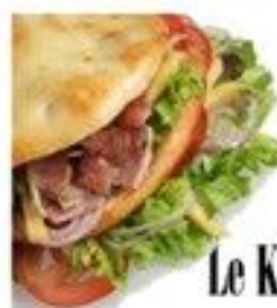
Le Kebab 5.50 €