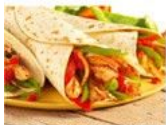
La Fajitas poulet 4.50 €