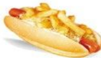
Le hot-dog frite (double saucisses frite) 5.50 €