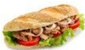
Le pain bagnat (thon ou poulet) 4.50 €