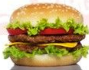
Le Big Burger 4.80 €