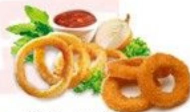
Beignets d'oignons ou de calamar 4 €