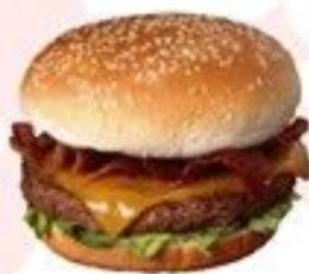
Le Bacon Burger 4 €